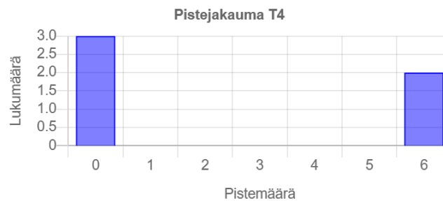
Tehtävän 4 pistejakauma.

Arvostelu pohjautui automaattiseen arvioon Liitteessä A esitettyjen arvostelukohtien/testitapausten kautta. Pisteet pyöristettiin alaspäin lähimpään kokonaislukuun.