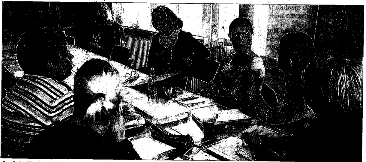
Jyväskylän yliopiston erityispedagogiikan laitoksen opiskelijoita ryhmätyön kimpussa.

Ilmastokeskuksen 15.6. julkistettu katsaus osoittaa, että erityisluokille siirrettyjen oppilaiden määrät ovat kasvaneet. Erityisluokille siirretty 33 000 peruskoulun oppilasta eli 5,7 prosenttia kaikista. Tilastolliset luvut ovat vielä suuria. Runsaassa kymmenessä luokassa määrä on kaksinkertaistunut. Vuosi nousnut Euroopassa kärkeen. Erityisluokat ja erityiskoulut olivat vanha tarpeellinen ilmiö. Kun koulun tila oli nykyistä suvaitsemattomampi, ne tarjosivat mahdollisuuden koulunkäyntiin niillekin oppilaille, joita opettajat eivät hyötynneet luokalleen. Nyt ajat ovat muuttaneet ja vähemmistöjenkin koulun kunnioitetaan entistä enemmän. Suvaitsevaisuuden lisääminen on tarkoittanut sitä, että koululle pyritään antamaan normaaliin ympäristöön. Luokkailmassa tämä tarkoittaa luokkia. YK onkin hyväksynyt periaatteen, jonka mukaan jokaisen lasten tulisi käydä koulua. Tältä pohjalta Suomen erityisopetusluvut alkavat muuttua ihmisoikeusongelmalta. Koulutukseen taas luokanopettajia Koululaitoksen rakenteet on laajasti suunniteltu tukemaan rinnakkaisjärjestelmää. Tärkeintä on erityisopettajakoulu-