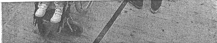
Vammaiset lapset voivat vallan hyvin käydä tavallista koulua yhdessä muiden lasten kanssa.